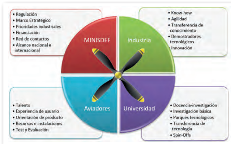
Modelo de innovación «Bacsi» de cuatro palabras.

Para ello, BACSI se ideó como un proyecto exploratorio que permitiera al EA adquirir conocimiento en áreas deficitarias, principalmente relacionadas con las tecnologías de la cuarta revolución industrial (también conocida como Industria 4.0) y de la sostenibilidad medioambiental. Esta revolución se caracteriza por la convergencia de tecnologías digitales, físicas y biológicas, y está impulsada por avances en áreas como la inteligencia artificial, el aprendizaje automático, la conectividad 5G, la robótica, el internet de las cosas, la realidad virtual, la fabricación aditiva, la computación en la nube, etcétera.