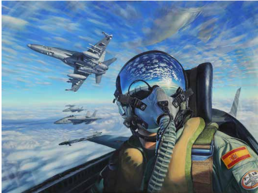
“Blindando el aire” JAVIER RAMOS JULIÁN Óleo sobre lienzo, 130 × 97 cm