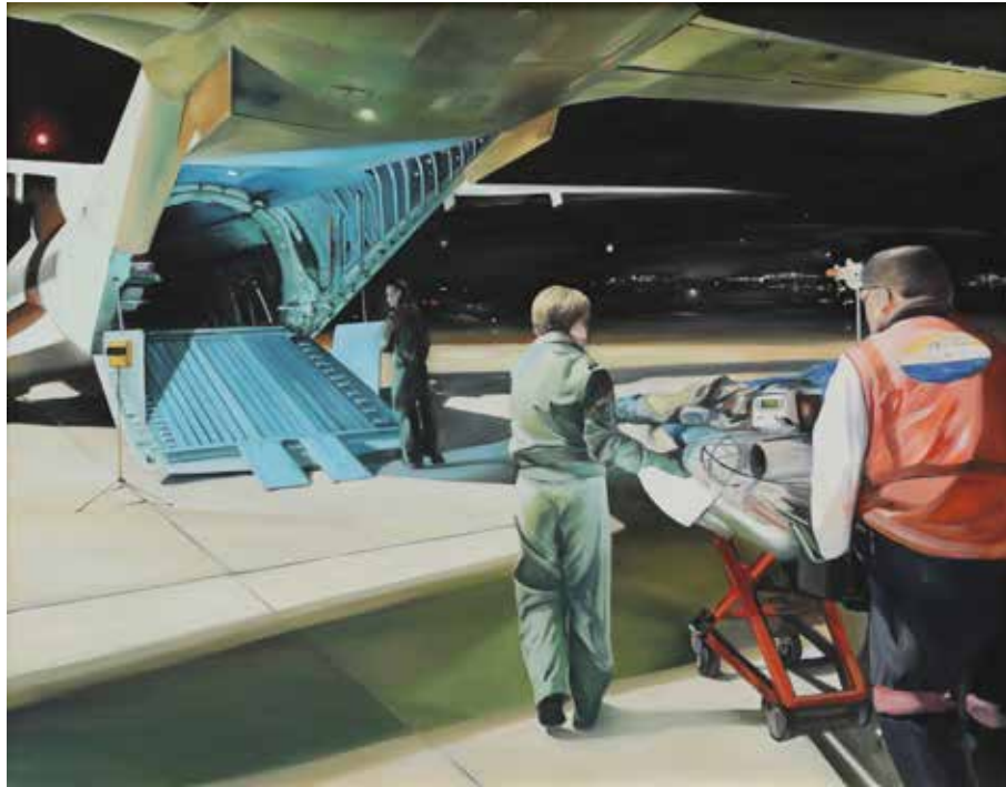
“Urge la vida” ROSA MARÍA VALBUENA CUESTA Óleo sobre lienzo, 146 × 114 cm