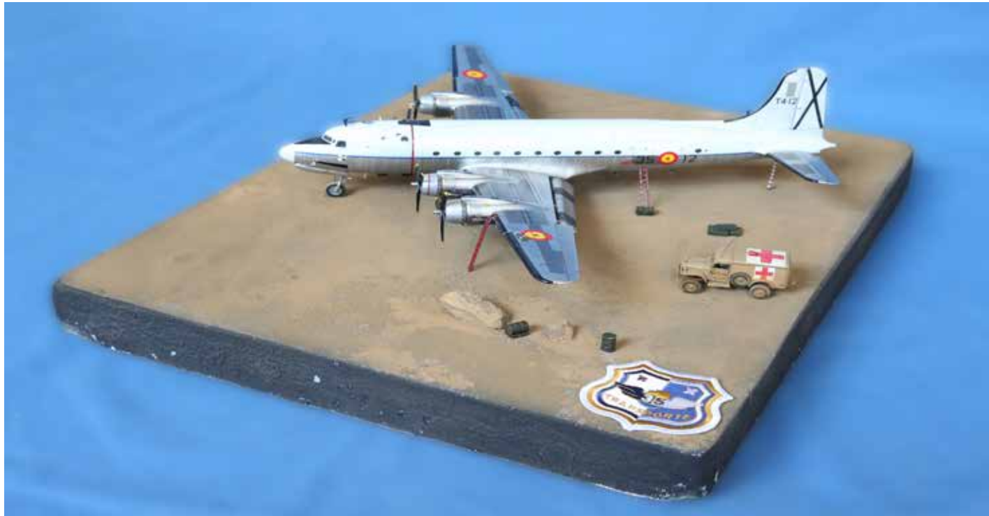
“ALA 35. TUCAN 12” MIGUEL LOZARES SÁNCHEZ Escala 1/72