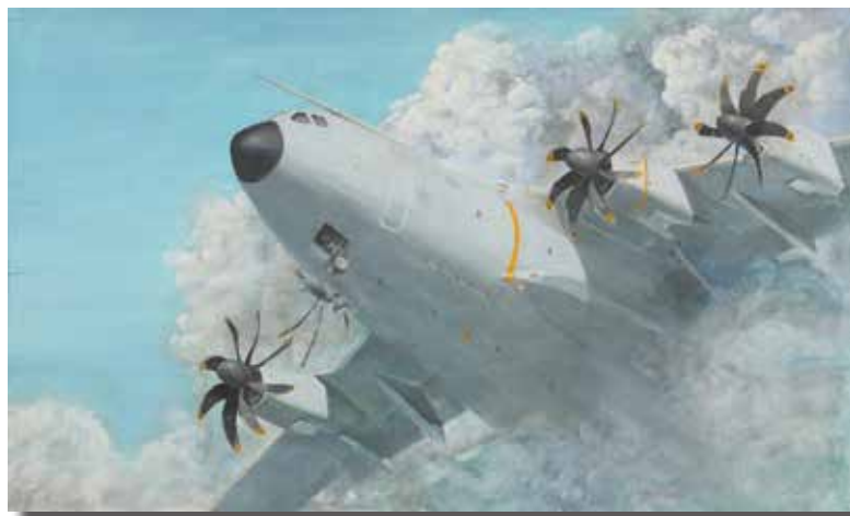
“Eolo” JESÚS MARTÍN TALÓN Técnica mixta sobre tabla, 150 × 90 cm