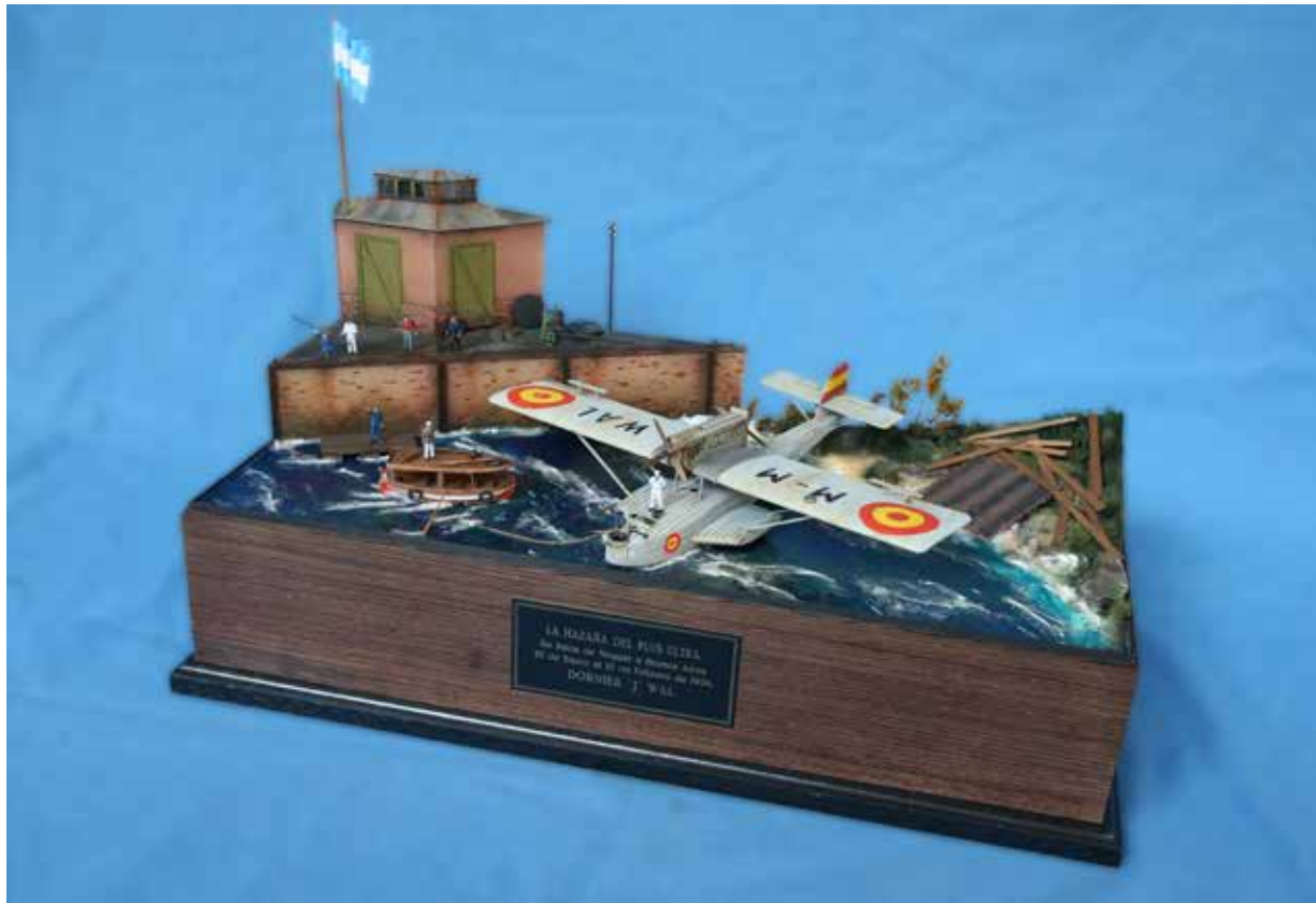
“La hazaña del Plus Ultra” ÍÑIGO RODRÍGUEZ CABALLEIRA Escala 1/72