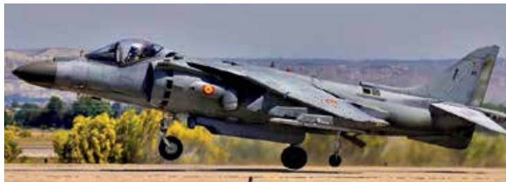
AV8B Harrier II.

¿Y cómo será el entorno geoestratégico en 2030+? Más allá de la incertidumbre del futuro en un mundo multipolar y globalizado, sujeto a una amplia variedad de amenazas multi-direccionales, tanto militares como no militares, para el caso español se podría aseverar la continuidad del principal objetivo asignado a la Defensa Nacional por la Estrategia de Seguridad Nacional de mayo de 2013, que no es otro que hacer frente a los conflictos armados que se puedan producir como consecuencia tanto de la defensa de los intereses o valores exclusivamente nacionales, como de la defensa de intereses y valores compartidos en virtud de nuestra permanencia a organizaciones internacionales 4 . Como certeramente comenta Mario Laborie en su análisis de la Estrategia de Seguridad Nacional 5 , la cultura estratégica nacional y