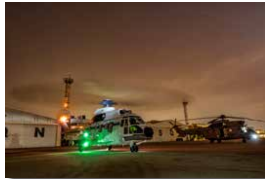
“Los señores de la noche” ANDRÉS MAGAI SEIBT