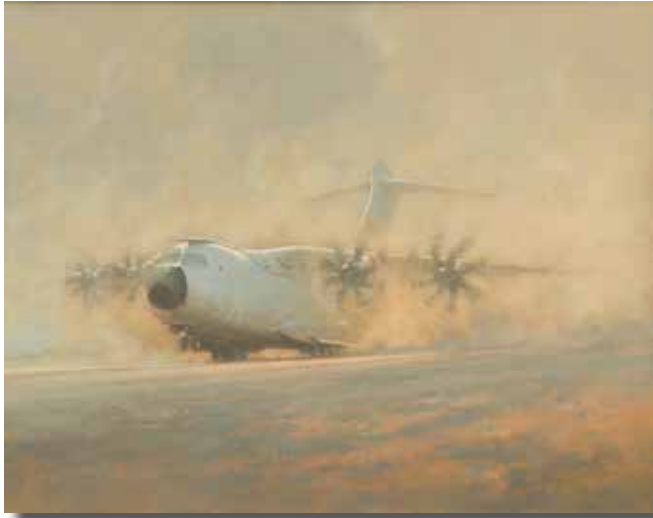
“Airbus A400M” JUAN JOSÉ VICENTE RAMÍREZ Acrílico sobre madera, 110 × 140 cm