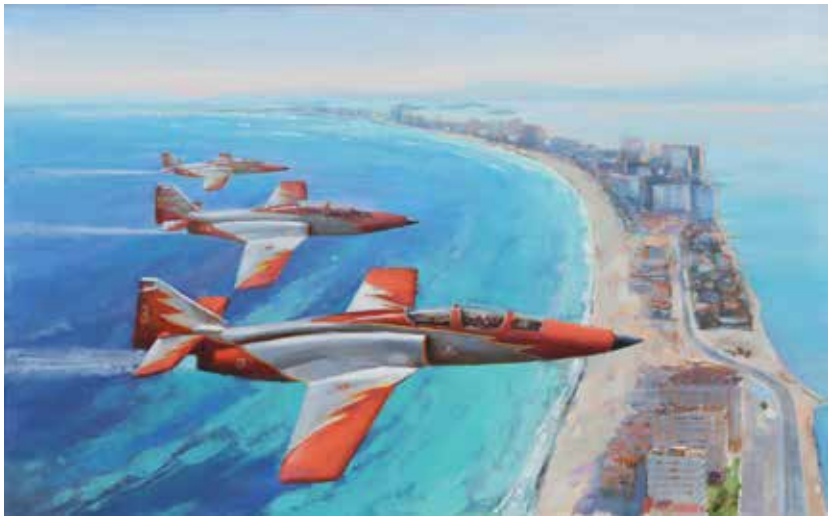
“Patrulla águila sobre la manga del mar menor” CARLOS MONTERO GIL Acrílico sobre tabla, 120 × 75 cm