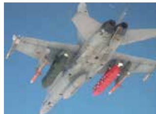
Integración del misil TAURUS en el C.15.

Pero nuevos retos aparecen en el horizonte, y el EA busca un posible sustituto del C.15 en la figura del FCAS (Futuro Sistema de Combate Aéreo), un "sistema de sistemas" que combinará cazas tripulados y RPAS (Remotely Piloted Aircraft System)