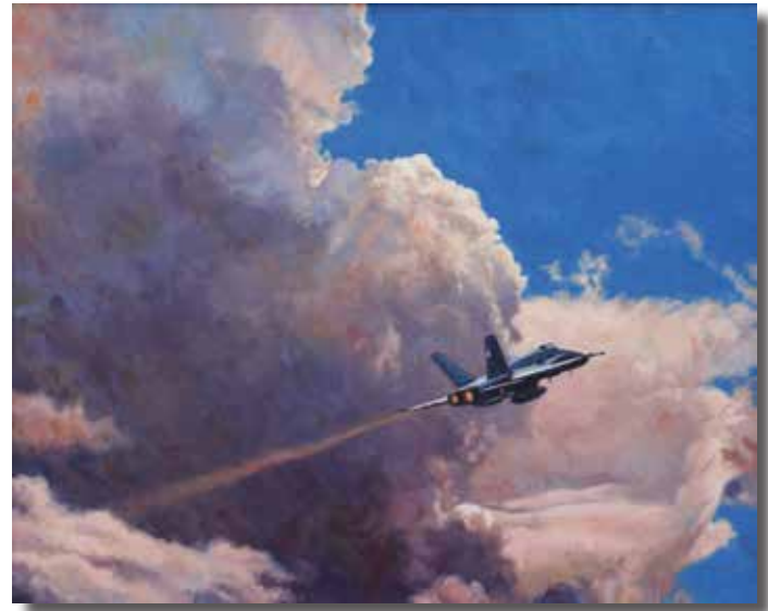
“La poética del vuelo” NEMESIO GARCÍA BALSERA Óleo sobre lienzo, 100 × 81 cm