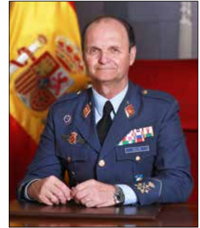
JAVIER SALTO MARTÍNEZ-AVIAL Jefe de Estado Mayor del Ejército del Aire

Por último, quisiera agradecer a los miembros del jurado su difícil pero necesaria labor; y, por supuesto, a las empresas patrocinadoras que con su inestimable apoyo han contribuido a hacer realidad una nueva edición de los Premios Ejército del Aire.