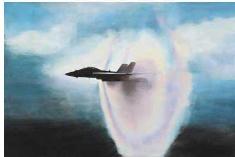
“Coloreando el sonido” MANUEL MARTÍN-FONTECHA CORRALES Óleo sobre lienzo, 150 × 100 cm