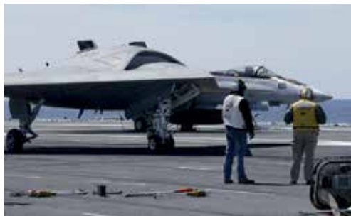
RPA de combate Northrop Grumman X-47B junto a un F-18.