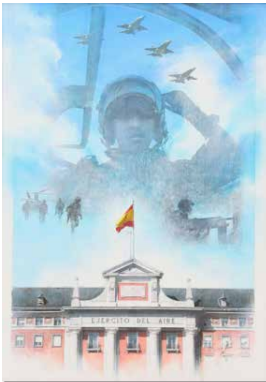
“Servicio y honor” ANDRÉS CASTELLANOS GARCÍA Acrílico sobre tabla, 162 × 114 cm