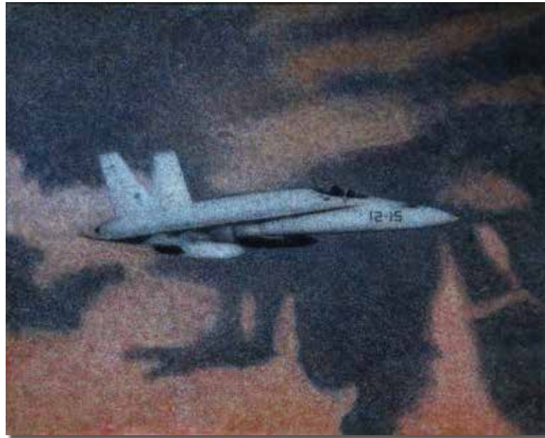
“Altos vuelos” TOMÁS LÓPEZ MARTÍNEZ Óleo sobre lienzo 130 × 100 cm