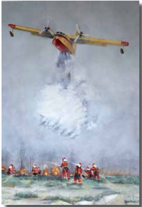
“Aire y Tierra, Agua y Fuego ” JUSTO ORÓ ARANDA Acuarela sobre papel, 100 × 70 cm